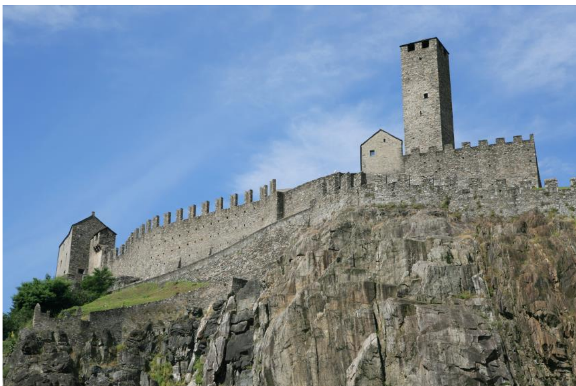
スイス ベッリンツォーナ旧市街の3つの城と防壁・城壁群

パスファインダーとは、調べたいと思う事柄について役立つ資料を、わかりやすく紹介した印刷物（リーフレット）のことです。