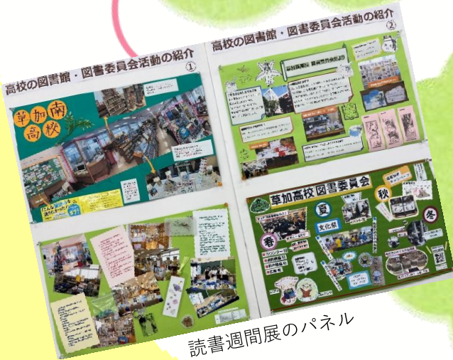
読書週間展のパネル