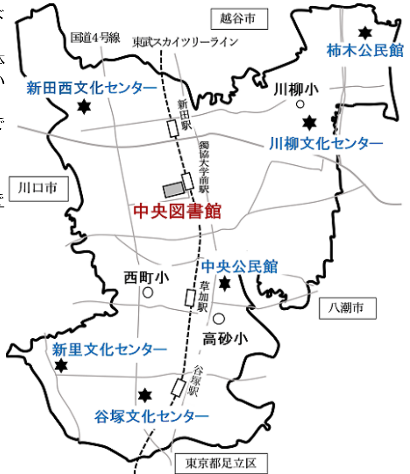
草加市図書館サービスMAP