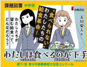
第71回 青少年読書感想文全国コンクール