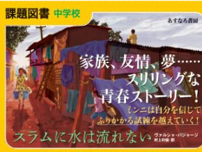
第71回 青少年読書感想文全国コンクール