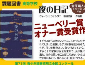
第71回 青少年読書感想文全国コンクール