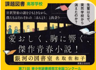
第71回 青少年読書感想文全国コンクール