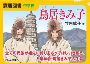
第71回 青少年読書感想文全国コンクール