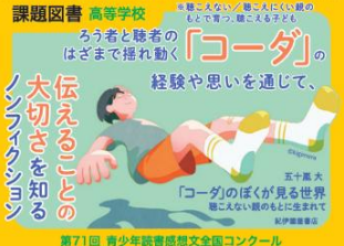
第71回 青少年読書感想文全国コンクール